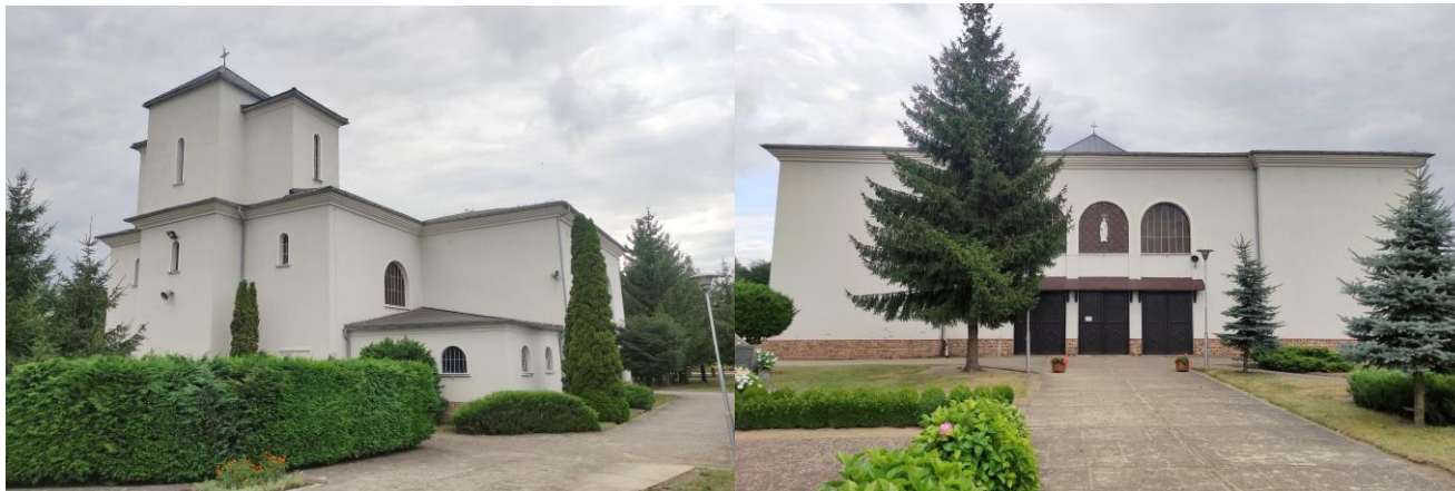
Zdjęcia nr 5, 6. Kościół ewangelicki, ob. rzym.-kat. parafialny pw. Chrystusa Króla, Bolewice, ul. Świebodzińska 35