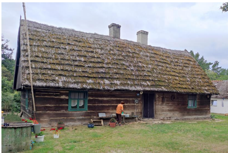
Zdjęcie nr 8. Bolewicko nr 18, dom mieszkalny