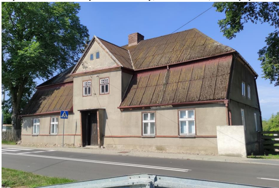
Zdjęcie nr 7. Młynarzówka, ob. budynek mieszkalny, Miedzichowo, ul. Zbąszyńska 2

Budynek wzniesiony prawdopodobnie w poł. XIX w. Po 1945 r. dom wraz z obiektami przemysłowymi i gospodarczymi należał do Rejonowych Młynów Gospodarczych w Nowym Tomysłu, następnie własność gminna. Od 1984 r. własność prywatna. Pierwotnie w skład zagrody młyńskiej wchodziła jeszcze stodoła i kurnik.