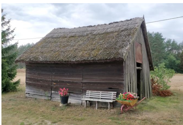
Zdjęcia nr 9, 10. Bolewicko nr 18, obora i stodoła

Wnętrza tych domów są równie interesujące. Na ścianach działowych lub ścianie kominowej budowano bardzo charakterystyczną szafę wnękową. Szafę dobiły dwuskrzydłowe, drewniane drzwi, zazwyczaj z szybkami u góry. Ciekawym elementem znajdującym się w tzw. dużej izbie był piec kaflowy, często ozdobione gzymsem, usytuowane w narożniku przy ścianie oddzielającej izbę od alkierza lub też stawiane w małej izbie na zasadzie wykorzystywania istniejącej ścianki. Belki stropowe ozdabiano podłużnymi żłobieniami oraz rozetą – znakiem mistrza ciesielskiego. W oknach umieszczano drewniane okiennice.