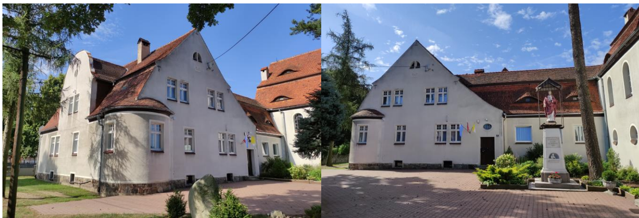
Zdjęcia 3, 4. Pastorówka, ob. plebania w zespole kościoła poewangelickiego pw. Św. Stanisława Bpa, Miedzichowo ul. Poznańska 37

Budynek usytuowany przy kościele, przylega do niego od wsch. Pastorówka nie przebudowana, pełni do dziś funkcję plebani.